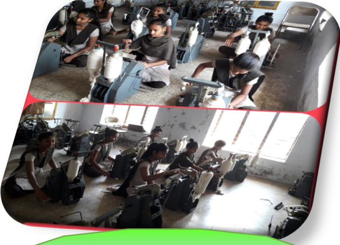
અંબર કાંતણ યજ્ઞ